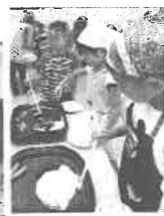
朝食は、スクランブルエッグとウインナー

数年前、あんなに小さかった子ども達が・・・ 2日目の朝、子ども達の表情は自信に満ちてきらきら輝き、日に焼けた体と共に、大きく大きく見えました。