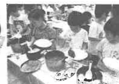
4グループの味 せ～んぶ制覇!! 食器洗いと片付け