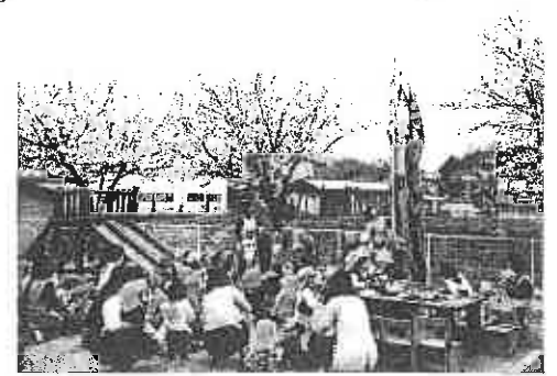
(こいのぼりを揚げるメロン組の男の子達)

4月27日端午の節句のお祝いをしました。『端午の節句』の由来を聞き、『かしわ餅』を作り会食をしました。