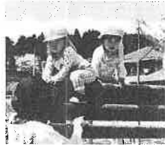
保育士に見守られながら、双子山に登るいちご組さん