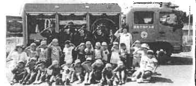
(消防士さんと一緒に“敬礼”のポーズで写真を撮りました)