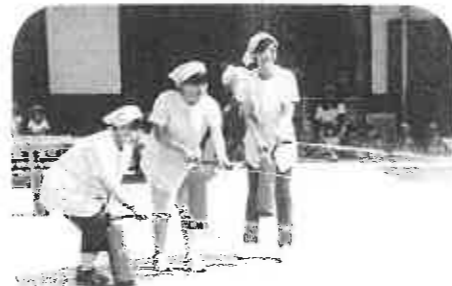
(消火訓練を行う給食室の先生達)