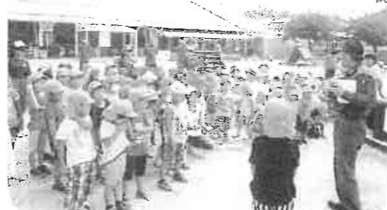
(消防士さんの話を、真剣に聞く子ども達)