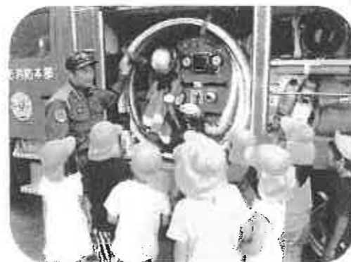
(ポンプ車の色々な道具を見せて頂きました)