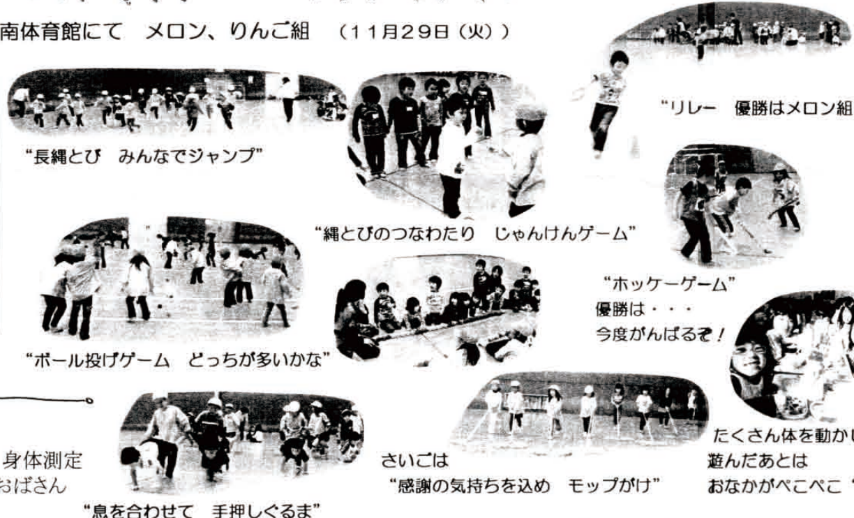
“長縄とび みんなでジャンプ” “リレー 優勝はメロン組” “縄とびのつなわり じゃんけんゲーム” “ボール投げゲーム どっちが多いかな” “ホッケーゲーム” 優勝は・・・ 今度ががんばるぞ! たくさん体を動かして 遊んだあとは おなかがべこべこ “いただきまあす” さいごは “感謝の気持ちを込め モップがけ” “息を合わせて 手押しくるま”

【ねらい】 ・金谷川幼稚園の幼児と 一緒に共通の目的を持ち、 ルールを守りながら集団遊 びをする中で、協力して 物事をやり遂げようとする 気持ちを持つ。 ・広い環境の中で交流を深 め、伸び伸びと体を動かし、 心身ともに充実感を味わう。